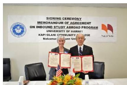
調印式の様子（2017年5月27日撮影）