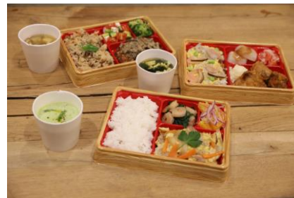
販売される一汁三菜Bento “Benefit On”