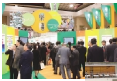
会場入口のテーマ展示