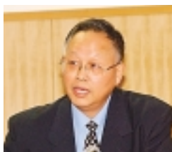
上海中医薬大学 陳 徳興 教授