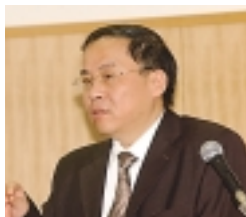
上海中医薬大学 潘 祥龍 教授