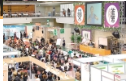
会場前方に設けられたイベントステージ