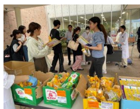
栄養や食に関する情報発信イベントの様子。