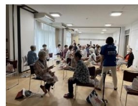
地域の方への熱中症予防セミナーの様子。