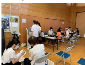
公民館で高齢者対象の健康度測定の様子。