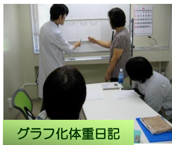
グラフ化体重日記