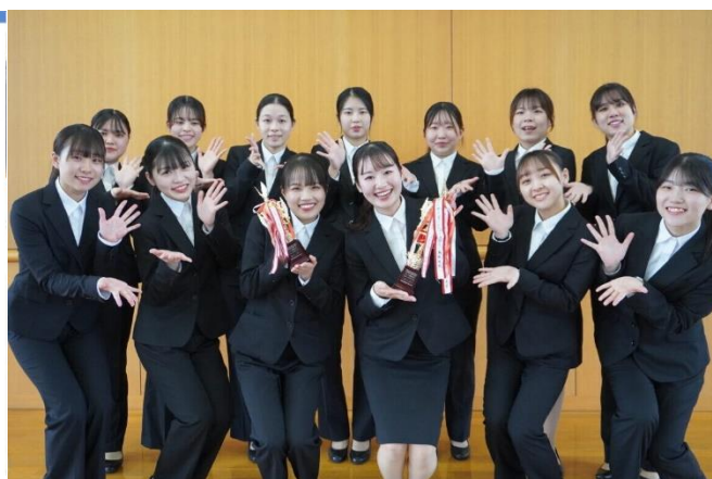
第27回インターンシップ・グランプリ受賞者