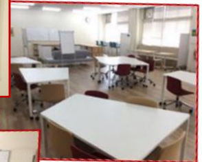
ラーニングスペース