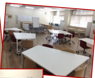
ラーニングスペース